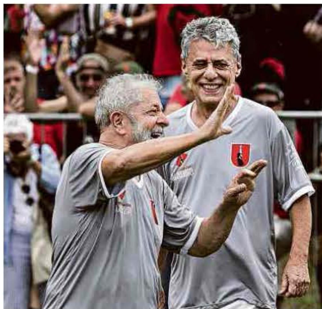
Lula festeja gol ao lado de Chico Buarque

Lula joga bola em campo do MST, faz gol, tira a camisa e leva cartão amarelo