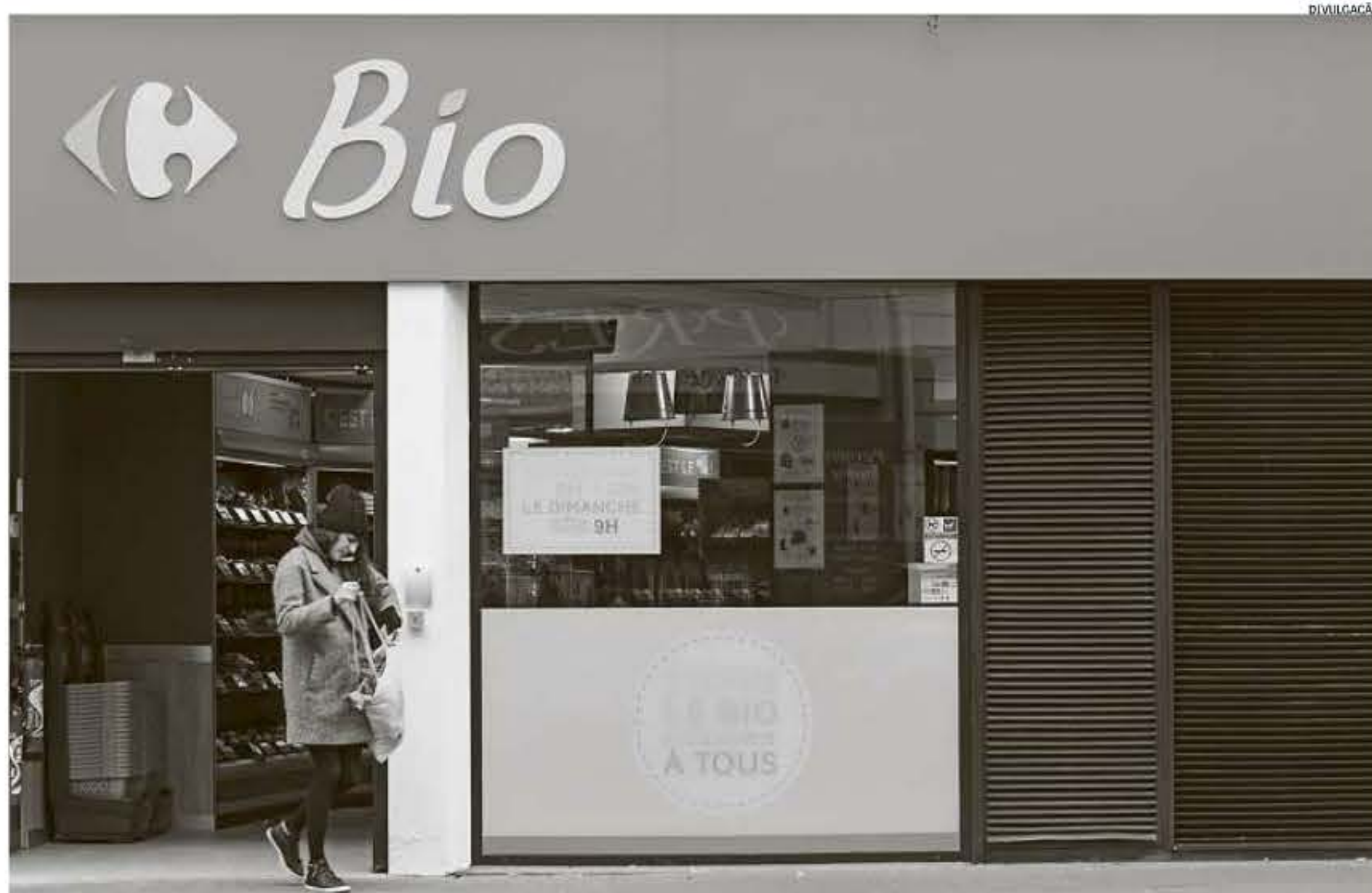
Artigos orgânicos custam 20% mais caro que produtos comuns, e quase metade dos 3 mil itens encontrados na nova rede é de marca própria do Carrefour

Nesta semana, a varejista comprou o site francês Greenweez, de vendas on-line de produtos orgânicos e ecológicos, com mais de 35 mil artigos e faturamento de quase R$ 20 milhões. "O mercado de orgâ-